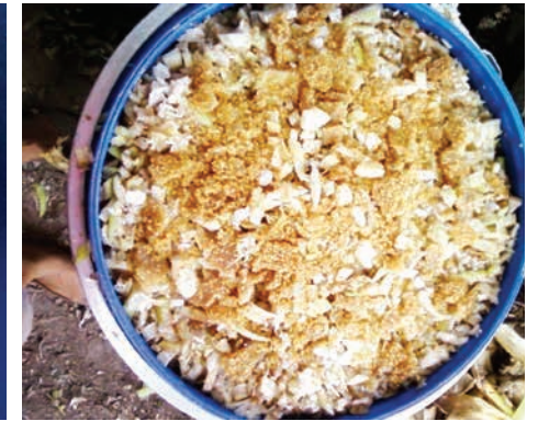
• ทิ้งไว้ 4 - 5 วัน สามารถนำไปให้ช้าง ม้า แพะ แกะ วัว ควาย เบ็ด ไก่กินได้

การนำไปใช้ หลังจากหมักได้อย่างน้อย 5 วัน สามารถนำไปให้อาหารสัตว์ได้ เมื่อเปิดถึงหมักให้สังเกตหยมกกล้วยหมักที่ดีควรมีสีน้ำตาลเหลือง มีกลิ่นหอม หยมกกล้วยหมักควรให้ร่วมกับอาหารชั้น หรือวัตถุดิบอาหารสัตว์ชนิดอื่น เช่น รำ มันสำปะหลัง เป็นต้น เพื่อเป็นการเพิ่มคุณค่าทางโภชนาการของอาหาร ไม่ควรให้หยมกกล้วยหมักแก่สัตว์เพียงอย่างเดียว